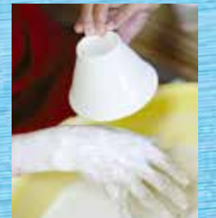
窯入れ前の釉薬掛け