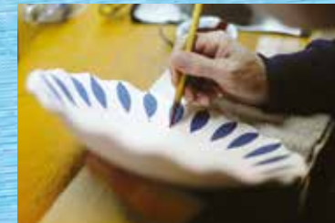
手早く丁寧な絵付け作業

私たち翔芳窯は創業から一貫して手描きにこだわり続けています。自然をモチーフに絵付け技法の特性を生かしながら様々な表情を器に吹き込む。ふっと懐かしさを感じるものからモダンで新鮮味あふれるもの。そのひとつひとつに手描きゆえの個性があり、温かみがあり、出会いがあります。たくさんのお会いを作り、幸せと楽しみを食卓へ届けるために。多様化するライフスタイルにフィットする製品を提案していきます。