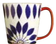
ブルーフラワー [大]

ほっと一息は お気に入りのマグで デザインを引き立てるシンプルな形状。 持ちやすく、飲みやすい口あたりで用途 に合わせて大きさも選べます。